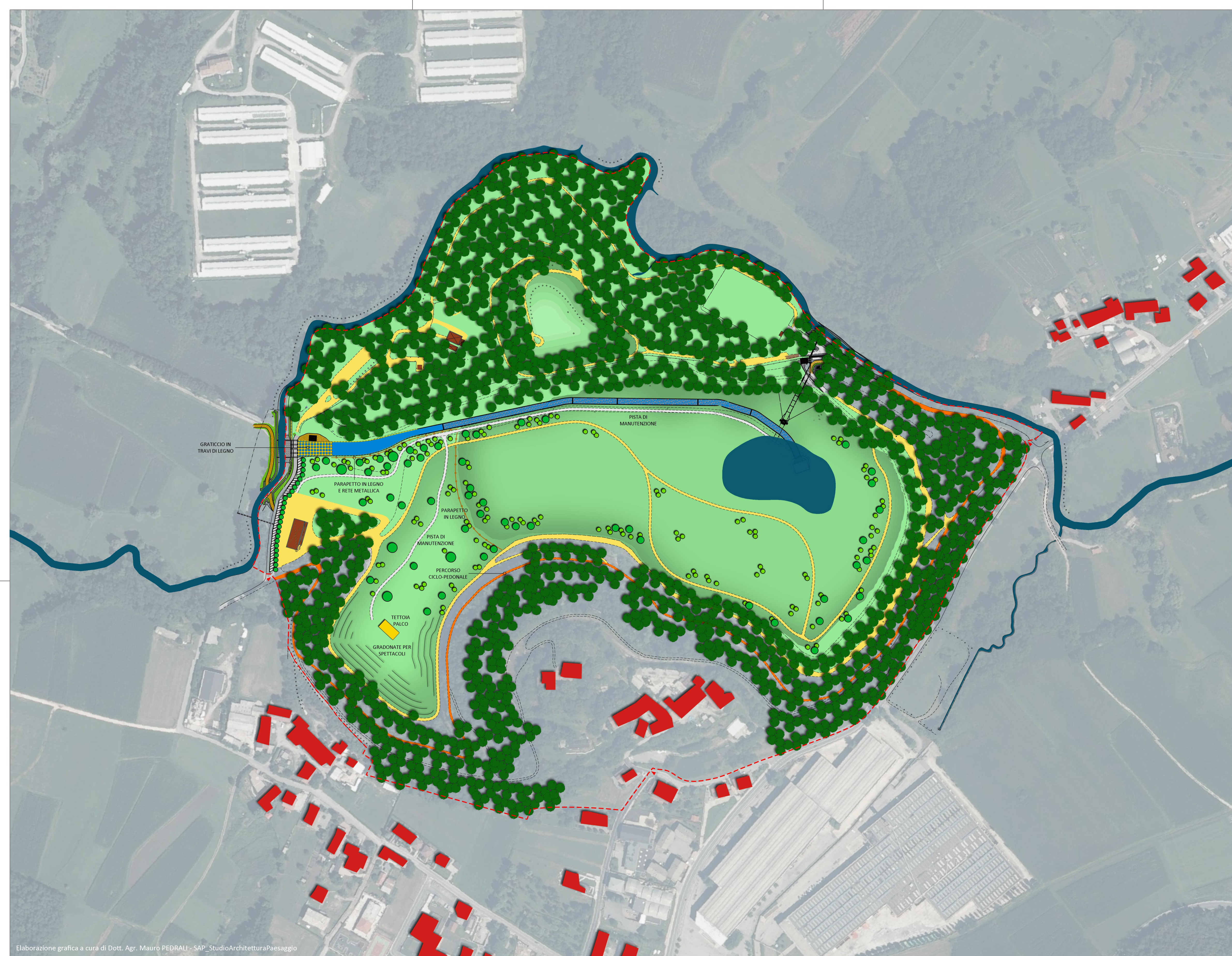
Elaborazione grafica a cura di Dott. Agr. Mauro PEDRALI - SAP_StudioArchitetturaPaesaggio